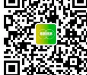
学校招生就业微信平台