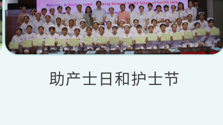
助产士日和护士节