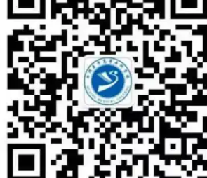
学校官方微信平台

就业领域： 面向医养融合型养老机构、社区卫生服务机构、老年福利院、康复护理中心、养生会所和社会健康管理、咨询、指导机构。