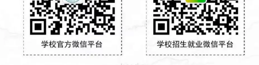
助产士日和护士节