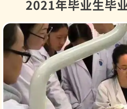
龋齿窝洞充填术学习